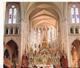
BASILICA DE LUJAN