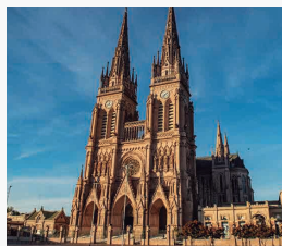
BASILICA DE LUJAN