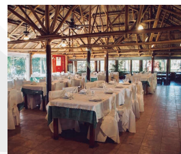
CHACRA “EL RANCHO”