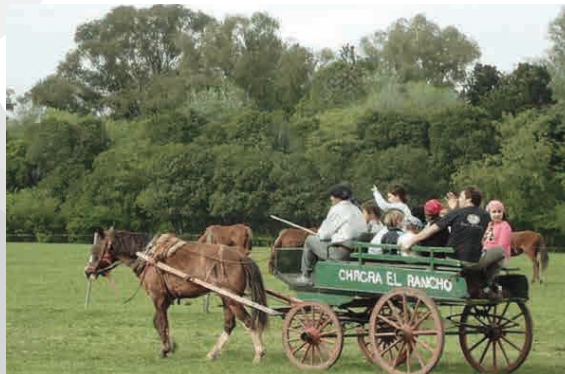
CHACRA “EL RANCHO”